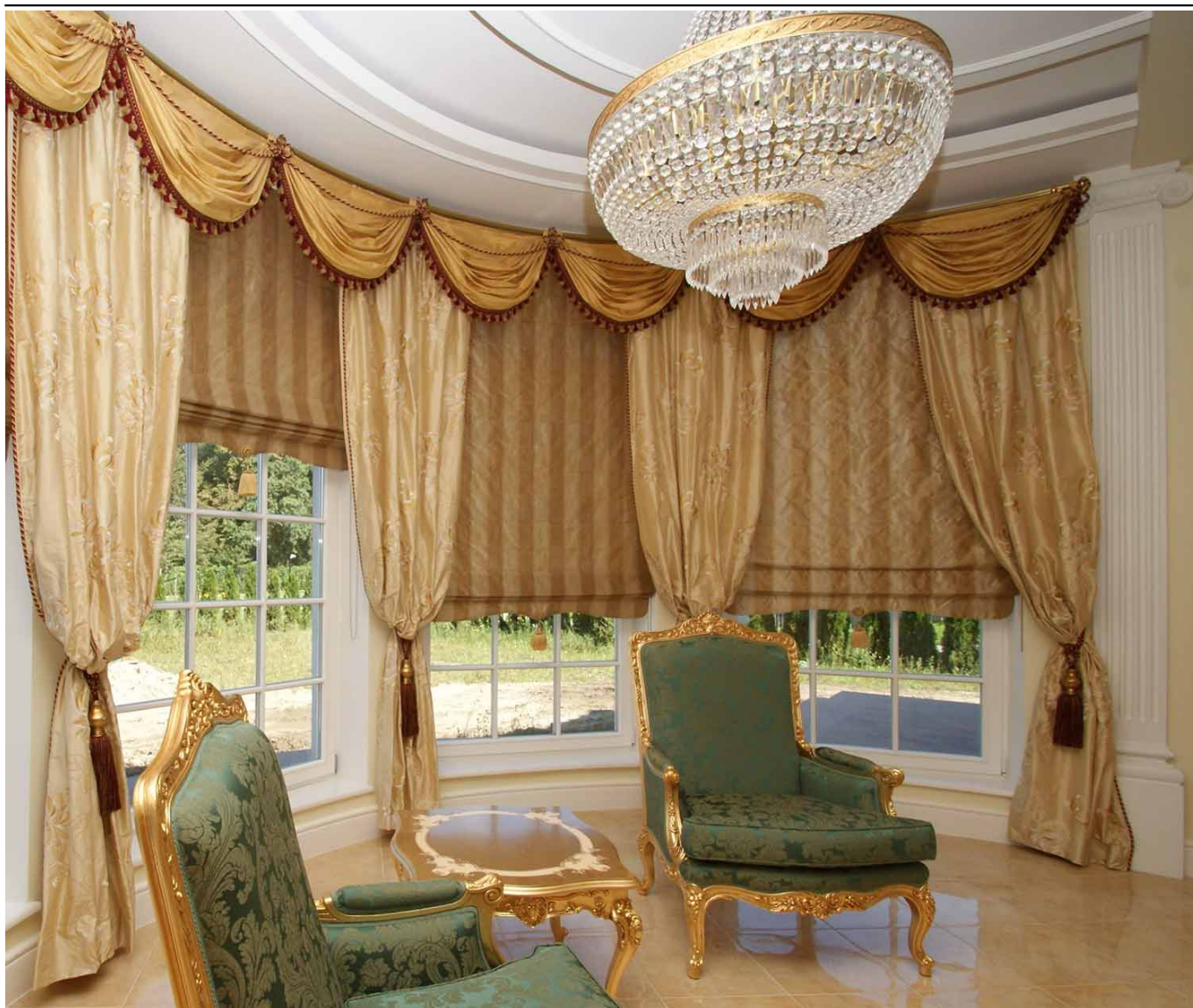
Karnisz gięty w łuk poziomy.

Jeśli wymagana jest możliwość przesuwania zasłon bez ograniczeń wspornikami, to proponujemy zdecydować się na karnisz profilowy z okrągłym profilem \varnothing 19 mm z funkcją szyny.