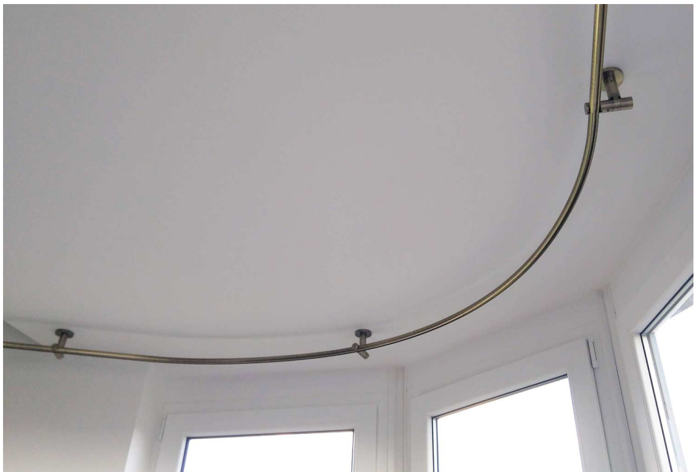
Karnisz z profilem szynowym gięty w łuk poziomy.

Wycenę karnisza giętego w łuk wykonujemy indywidualnie do każdego projektu.