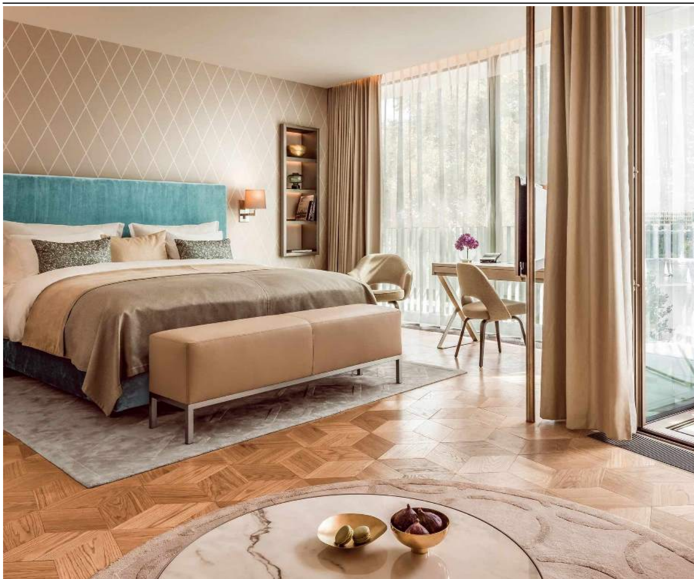
Szyna sufitowa podświetlona LED

Szyna DS XL LED została wyróżniona prestiżową nagrodą Red Dot Award, uznawaną za jedną z najważniejszych nagród na świecie w dziedzinie wzornictwa, często nazywaną „Oscarem designu”.