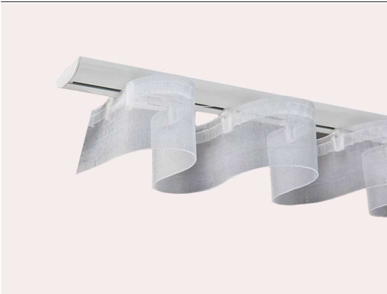
System EasyFlex firmy Forest upinający tkaninę w falę (system wave)

Montaż szyny sufitowej jest niezwykle łatwy dzięki klikalnym elementom. Istnieje możliwość zamocowania szyny na wspornikach ściennych (dystans osi szyny od ściany 9 cm).